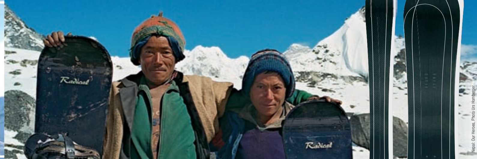
Nepal: Our Heroes

Alle BoarderInnen und SkifahrerInnen haben ihre individuellen Körpermasse, ihren persönlichen Stil und ihre eigenen Anforderungen. Neben unserer Kleinserie bauen wir in unserer Zürcher Werkstatt seit 24 Jahren auch Custom-Boards und Custom-Skis. Wir stellen dabei jedes Board und jeden Ski in all seinen Faktoren als Einzelanfertigung exakt für den jeweiligen Fahrer und dessen Bedürfnisse her. Das Resultat ist eine individuell optimal abgestimmte Massanfertigung. Wir garantieren absolute Zufriedenheit!